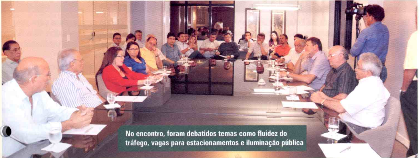
No encontro, foram debatidos temas como fluidez do tráfego, vagas para estacionamentos e iluminação pública