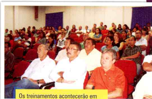
Os treinamentos acontecerão em todas as CDLs do Estado